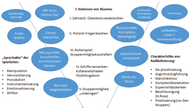
Abb. 1: Stationen des Spiels. „Trichter“ der kognitiven Engführung während des Spiels. (eigene Darstellung): In römischen Ziffern die inhaltliche Ebene des Spiels. Die blauen Ovale zeigen die manipulativen Interventionen auf der Ebene der Struktur des Spiels. Die Auflistung links zeigt die Interventionsmöglichkeiten der Spielleiter, die Auflistung rechts zeigt Parallelen zu Charakteristika von Radikalisierungsverläufen.