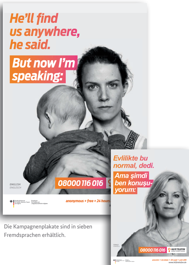
Die Kampagnenplakate sind in sieben Fremdsprachen erhältlich.