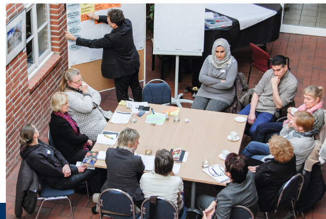
Workshop in Ludwigslust.