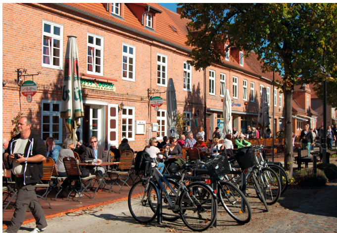
Straßenzug in Ludwigslust