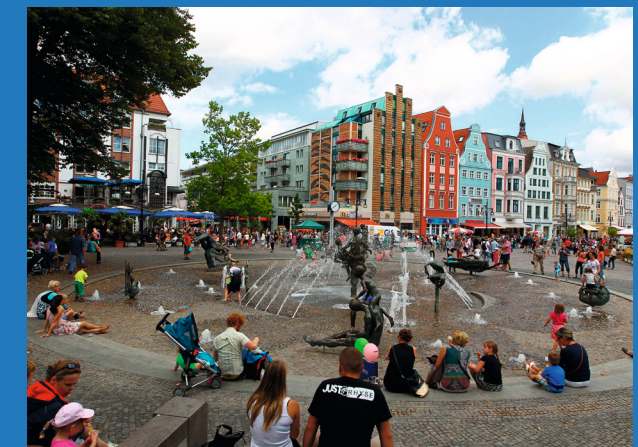
Titelbild, Rostock.

Gemeinsam sozialen Wandel und Integration gestalten