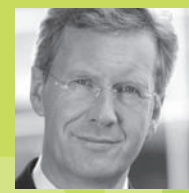
Grußwort des Niedersächsischen Ministerpräsidenten und Schirmherrn Christian Wulff