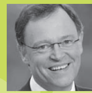
Grußwort des Oberbürgermeisters der Landeshauptstadt Hannover Stephan Weil