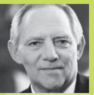
Festvortrag des Bundesministers des Innern Dr. Wolfgang Schäuble